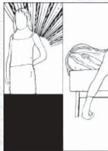
Grafik zu FUESSLI-Musik von Hagen Klennert